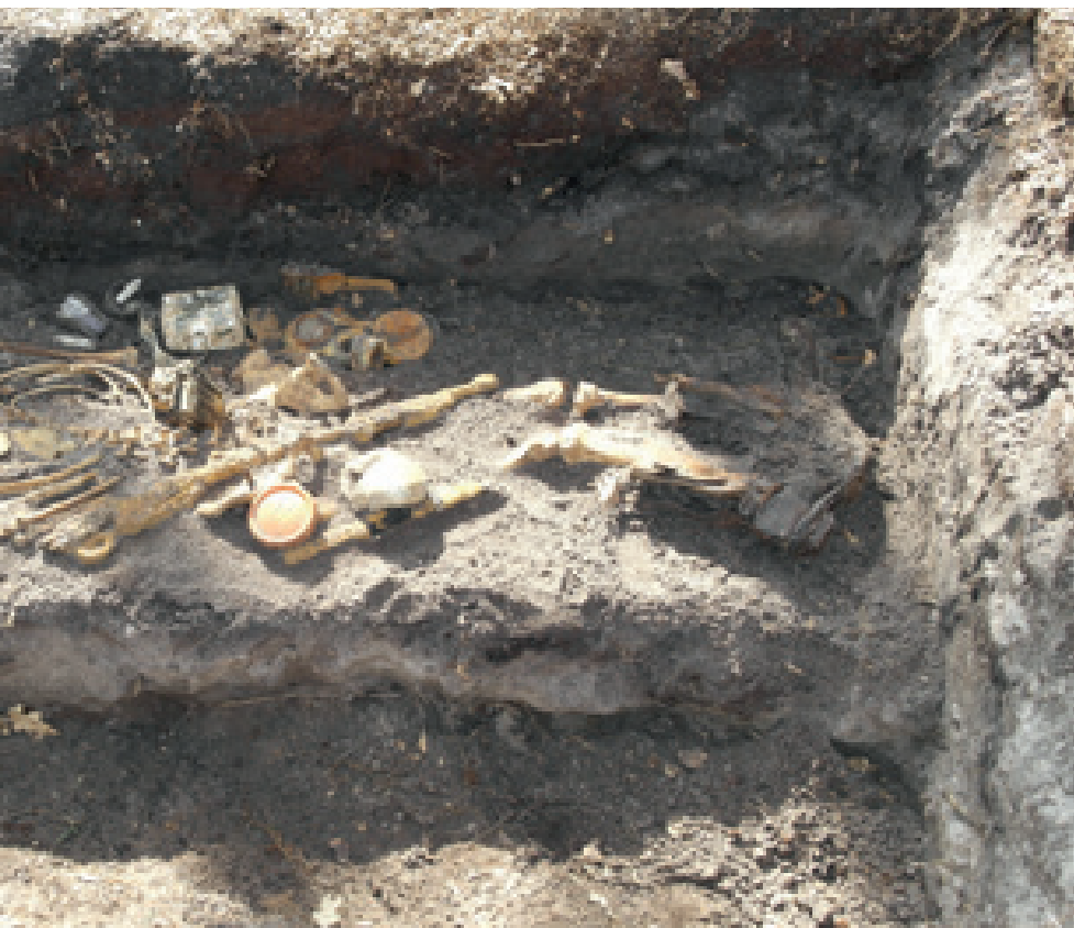
De medewerkers van de BIDKL openen veldgraven op forensisch archeologische wijze.

Nog met regelmaat stuiten mensen op veldgraven. Omdat er nog munitie of explosieven in het graf aanwezig kunnen zijn, is het zaak een dergelijke vindplaats niet aan te raken. Het is zeker niet de bedoeling om zelf een aangetroffen veldgraf te onderzoeken. Door het zogeheten ‘roeren’ van het graf kunnen veel waardevolle gegevens over de identiteit van het slachtoffer verloren gaan. Door het veldgraf te markeren en de stoffelijke resten weer af te dekken blijven belangrijke